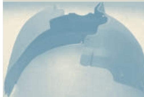
Cubierta de paso de rueda