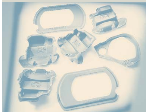
Parti termoformate Alveolit/Alveolen