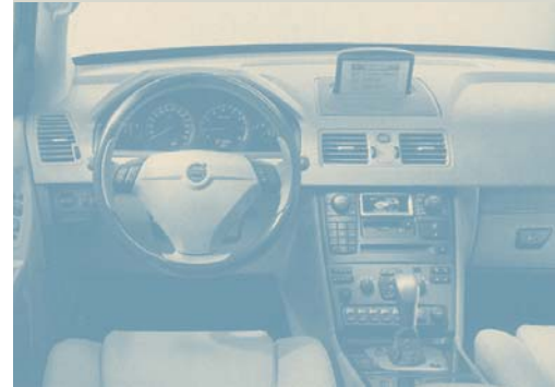
Planches de bord en polyoléfine

Pour des informations complémentaires concernant ces produits, nous vous prions de vous référer aux fiches techniques et aux spécifications de vente des produits, disponibles auprès de votre bureau local Sekisui Alveo.