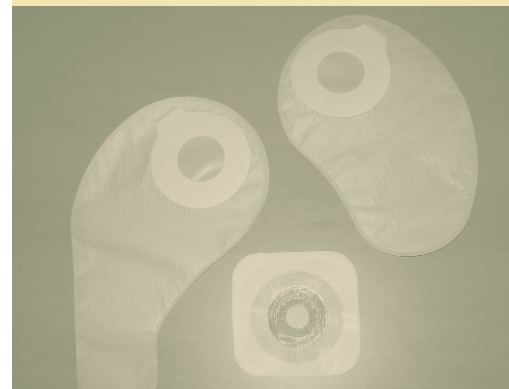
Presidi per stomia