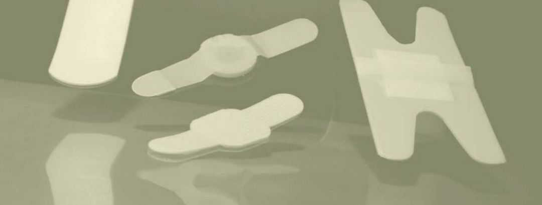
Bende di medicazione